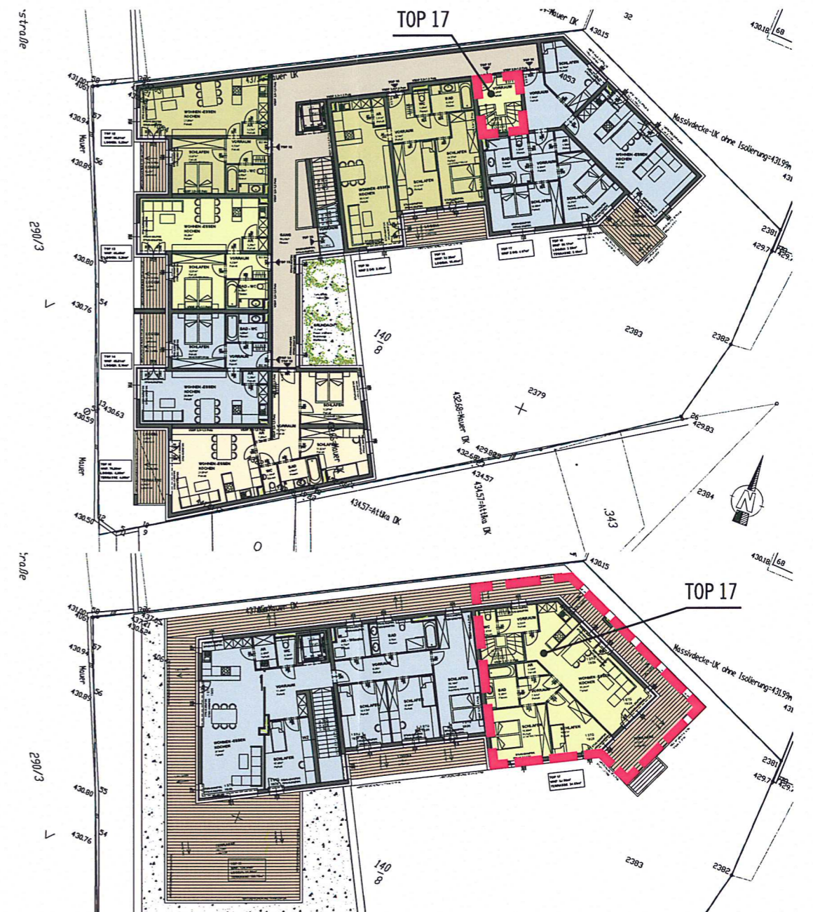
LAGEÜBERSICHT 2. OG & DG / 0. MASSSTAB

ÄNDERUNGEN VORBEHALTEN STAND EINREICHUNG