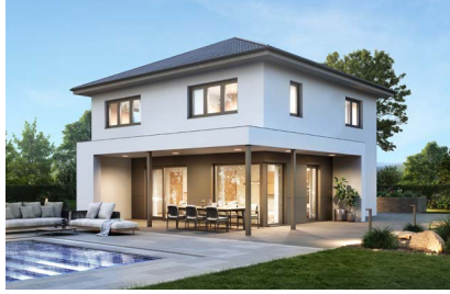
ELK All in One 148