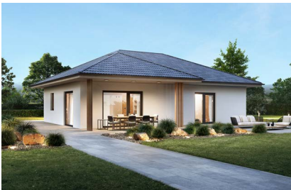
ELK All in One Bungalow 102