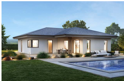
ELK All in One Bungalow 121