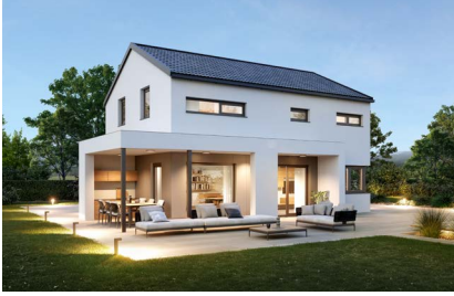
ELK All in One 131