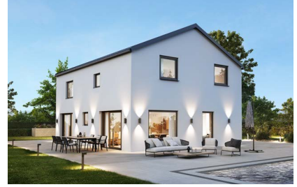
ELK All in One 159