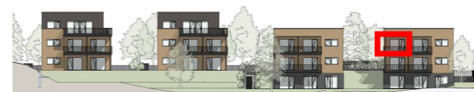
R4 R3 R2 R1