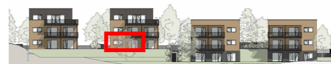
R4 R3 R2 R1